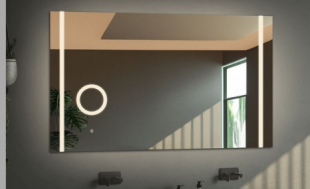
LUSTERKO ZOOM LED Z DEDYKOWANYM WŁĄCZNIKIEM DOTYKOWYM

To wbudowane w główne lustro lusterko powiększające, jest idealnym narzędziem dla osób dbających o detale. Zostało zaprojektowane z myślą o wygodzie i funkcjonalności. Lusterko ZOOM oferuje trzykrotne powiększenie obrazu, co umożliwia dokładne wykonywanie czynności takich jak nakładanie makijażu, golenie czy wykonywanie precyzyjnych zabiegów pielęgnacyjnych. Zastosowanie powiększającego lusterka o średnicy 12 cm w połączeniu z głównym lustrem daje użytkownikowi możliwość widzenia całości, a jednocześnie skupienia się na szczegółach. Średnica całego elementu to 14 cm. Lusterko posiada dodatkowo dookoła dekoracyjny mleczny pasek o szerokości 1 cm.