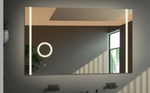
LUSTERKO ZOOM LED Z DEDYKOWANYM WŁĄCZNIKIEM DOTYKOWYM

To wbudowane w główne lustro lusterko powiększające, jest idealnym narzędziem dla osób dbających o detale. Zostało zaprojektowane z myślą o wygodzie i funkcjonalności. Lusterko ZOOM oferuje trzykrotne powiększenie obrazu, co umożliwia dokładne wykonywanie czynności takich jak nakładanie makijażu, golenie czy wykonywanie precyzyjnych zabiegów pielęgnacyjnych. Zastosowanie powiększającego lusterka o średnicy 12 cm w połączeniu z głównym lustrem daje użytkownikowi możliwość widzenia całości, a jednocześnie skupienia się na szczegółach. Średnica całego elementu to 14 cm. Lusterko posiada dodatkowo dookoła dekoracyjny mleczny pasek o szerokości 1 cm.